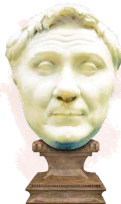
GNEJUSZ POMPEJUSZ MAGNUS ŻYŁ W I W. P.N.E.

Był wodzem i dyktatorem, podbił Galię (dzisiaj m.in. tereny Francji i Belgii) i Egipt. Został zamordowany w Idu Marcowe, czyli 15 marca, przez spiskowców w imię obrony republiki rzymskiej. Wywodził się z rodu ( gens ) Juliuszów, a jego przydomek ( cognomen ) prawdopodobnie pochodził z języka kartagińskiego i znaczył stoń .