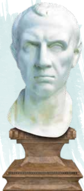
GAJUSZ JULIUSZ CEZAR ŻYŁ W I W. P.N.E.

Był jednym z najświetniejszych mówców rzymskich, adwokatem, pisarzem, politykiem i konsulem Rzymu. Do dzisiaj powtarzamy wiele jego powiedzeń, m.in. Alter ego czy Equi donati dentes non inspiciuntur . Pochodził z rodu ( gens ) Tulliuszów i nosił przydomek ( cognomen ) Cynceron, a cicer znaczy po łacinie groch .