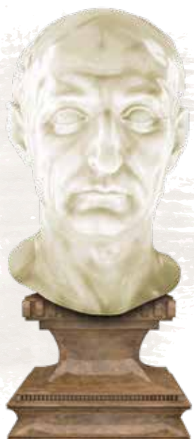
MAREK TULLIUSZ CYCERON ŻYŁ W I W. P.N.E.

RZYMIANIE NOSILI IMIĘ (PRAENOMEN), NAZWISKO (NOMEN GENTILE/GENS) I PRZYDOMEK (COGNOMEN)